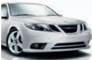
Saab 9-3 TTiD - 119g CO 2

En Suède, quand on veut plus qu'une voiture, on va chez Saab. A Liège, on va chez Beherman.