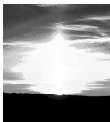
Aube au Mont Ventoux Gravi de nuit le 27-5-01